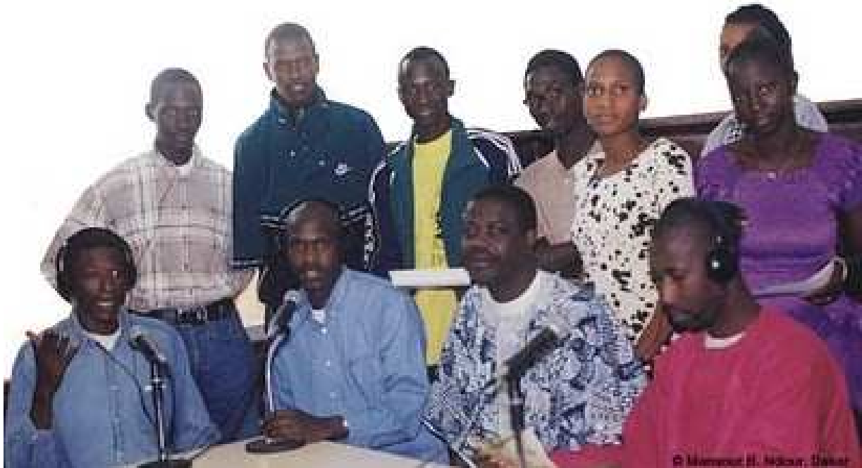
Quelques membres de l'équipe de 1999.